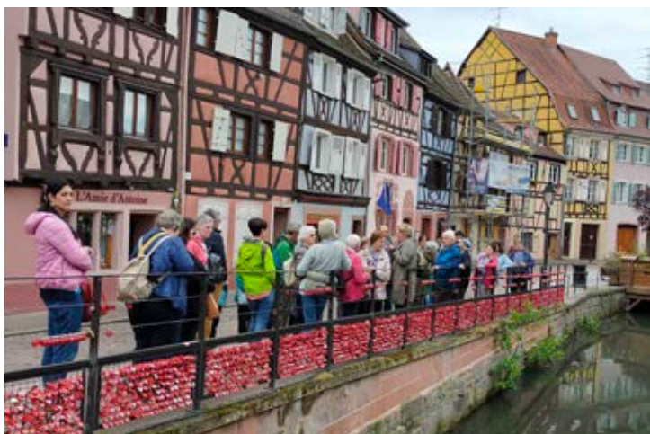
Zur Führung durch die Altstadt von Colmar gehört natürlich der Besuch von Klein-Venedig. Das ehemalige Fischer- und Gerberviertel liegt am Fluss Lauch, auf dem auch kleine Boote verkehren.

war aber bereits in vorchristlicher Zeit eine Kultstätte, wie Funde aus der Keltenzeit belegen. Zudem ist dieser Bergrücken mit seinen mächtigen Sandsteinfelsen auch ein wunderbarer Aussichtspunkt, von dem man in die Rheinebene und sogar bis nach Straßburg blicken kann. Nach einer Führung durch das Klostergebäude konnte noch jeder für sich diese symbolträchtige Stätte des Elsass entdecken.