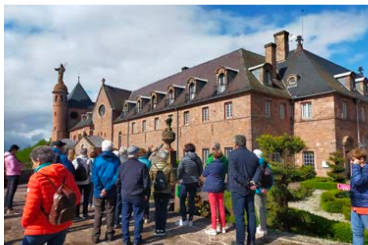
Erstes Ziel der Kulturreise war der Odilienberg, der „Heilige Berg des Elsass“. Von hier blickt die heilige Odilie, die Patronin des Elsass vom Turm der Klosterkirche auf die schöne Region zwischen Vogesen und Rheinebene.

Nur noch eine Staatsgrenze und etwa eine Stunde Fahrtzeit trennten die Schenner Reisegruppe noch von ihrem Ziel, der Stadt Colmar. Mit über 70.000 Einwohnern ist Colmar die drittgrößte Stadt im Elsass, doch mit den kleinen, bunten Fachwerkhäusern wirkt sie wie ein Städtchen aus einem Märchenbuch. Nachdem die Heimatspfleger im Hotel Turenne