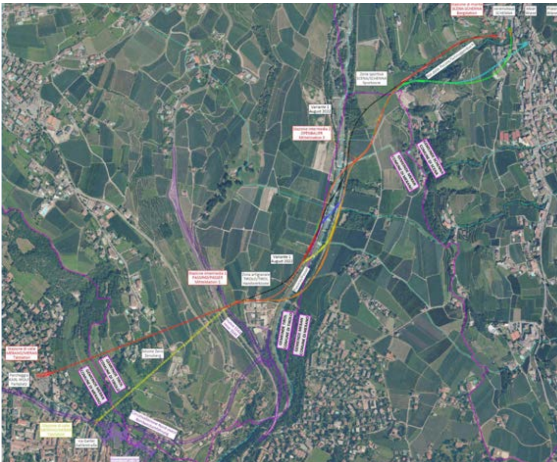
Insgesamt 12 Varianten wurden nach den verschiedenen Treffen untersucht.