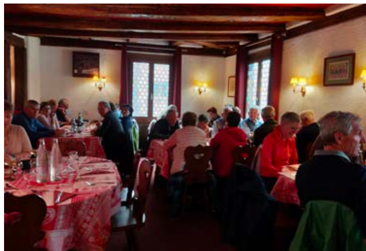
Gut und reichlich essen – das kann man im Elsass. Die Heimatpfleger haben die Mittagspause im gemütlichen Maison Pfeffer in Colmar sehr genossen.

Nach diesem kulturell intensiven Vormittag gab es im Restaurant Pfeffer, gleich neben dem Museum, ein reichhaltiges Drei-Gänge-Menü mit lokalen Spezialitäten. Danach ging es mit dem Bus nach Hunawir, einem kleinen Dorf an der Elsässer Weinstraße, welches als eines der schönsten Dörfer