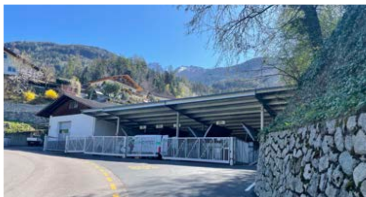
Der renovierte Recyclinghof in der Verdinserstraße