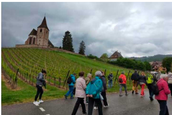
Inmitten der Weinberge liegt die Wehrkirche von Hunawir. Von hier starteten die Schenner zu einer Wanderung durch die Rosacker Weinlagen.

Frankreichs bekannt ist. Hier besichtigten die Schenner die kleine Wehrkirche aus dem 14. Jh, die - umgeben von einer mächtigen Umfassungsmauer - mitten in den Weinbergen liegt.