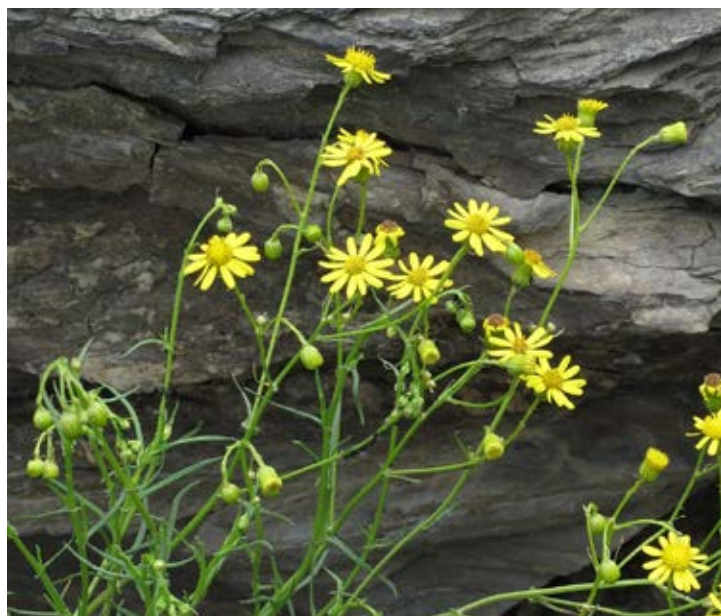
Das schmalblättrige Greiskraut , senecio inaequidens : enthält Alkaloide, die für Menschen und Tiere (Rinder, Schafe, Pferde) giftig sind. Ihre Giftigkeit bleibt auch im getrockneten Zustand (Heu) erhalten.

Einige dieser unerwünschten Pflanzen aus der von der Laiburg erstellten Schwarzen Liste stellt die Dorfzeitung in dieser und in den folgenden Ausgaben vor.