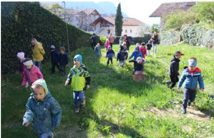
Osterhasensuche im Burggraben von Schloss Schenna