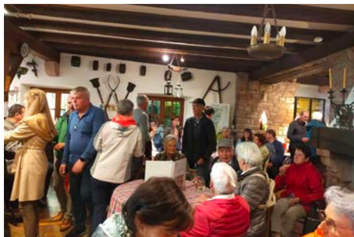
Hervorragende Weine konnten beim Weingut Jean Becker verkostet werden. Da wurden gerne auch ein paar Flaschen für Zuhause mitgenommen.

Weine der gleichen Rebsorte hervorbringt.