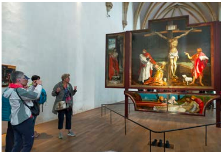
Der Isenheimer Altar im Unterlinden Museum zählt zu den bekanntesten Werken christlicher Kunst und beeindruckt die Besucher mit seinen ausdrucksstarken Bildern.

Nun ging es weiter in das nur wenige Kilometer entfernte Städtchen Sélestat. Dort besuchten die Heimatpfleger die romanische Ste-Foy-Kirche sowie die gotische St-Georges-Kirche, in der es riesige Buntglasfenster aus dem 15. Jh. zu bestaunen gibt.