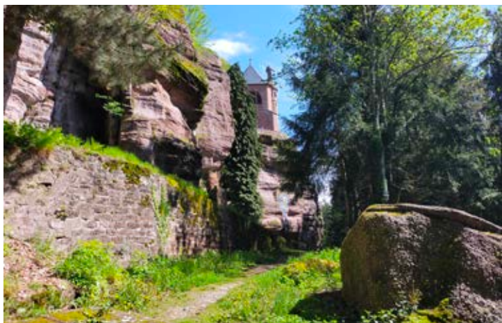
Der Odilienberg ist nicht nur der beliebteste Wallfahrtsort des Elsass, sondern mit seinen meterhohen Buntsandstein-Felsen auch ein beeindruckender Naturschauplatz.