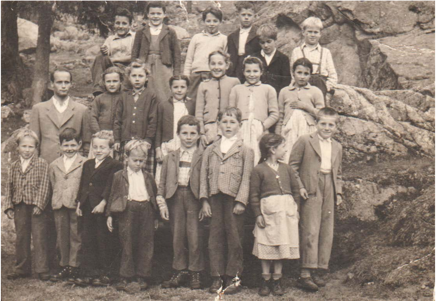
Die Schüler von Untertall der Jahrgänge 1947/1948 Ende der 1950er Jahre beim Maiausflug zur Ifinger Hütte