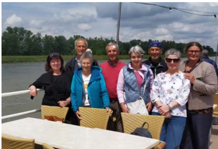
Zum Abschluss wurde am Heimreisetag noch eine Schifffahrt auf dem Rhein unternommen. Der Vereinsausschuss freut sich über die gelungene viertägige Kulturreise.

dem die Kirche liegt, war idealer Ausgangspunkt für eine Wanderung durch die Weinberge bis ins Nachbar-dorf Zellenberg. Auf dem Weg dorthin erzählte Reiseleiterin Caroline - selbst Tochter elsässischer Winzer - über den Weinbau im Elsass, das unter den Anbaugebieten Frankreichs als Pionierregion hinsichtlich biologischem Weinbau gilt. Auf den Rosacker Weinlagen rund um Hunawir gedeihen vor allem Riesling, Pinot Gris und Gewurztraminer von Grand-Cru-Qualität. Die Böden sind geologisch kleinstrukturiert, was ganz unterschiedliche